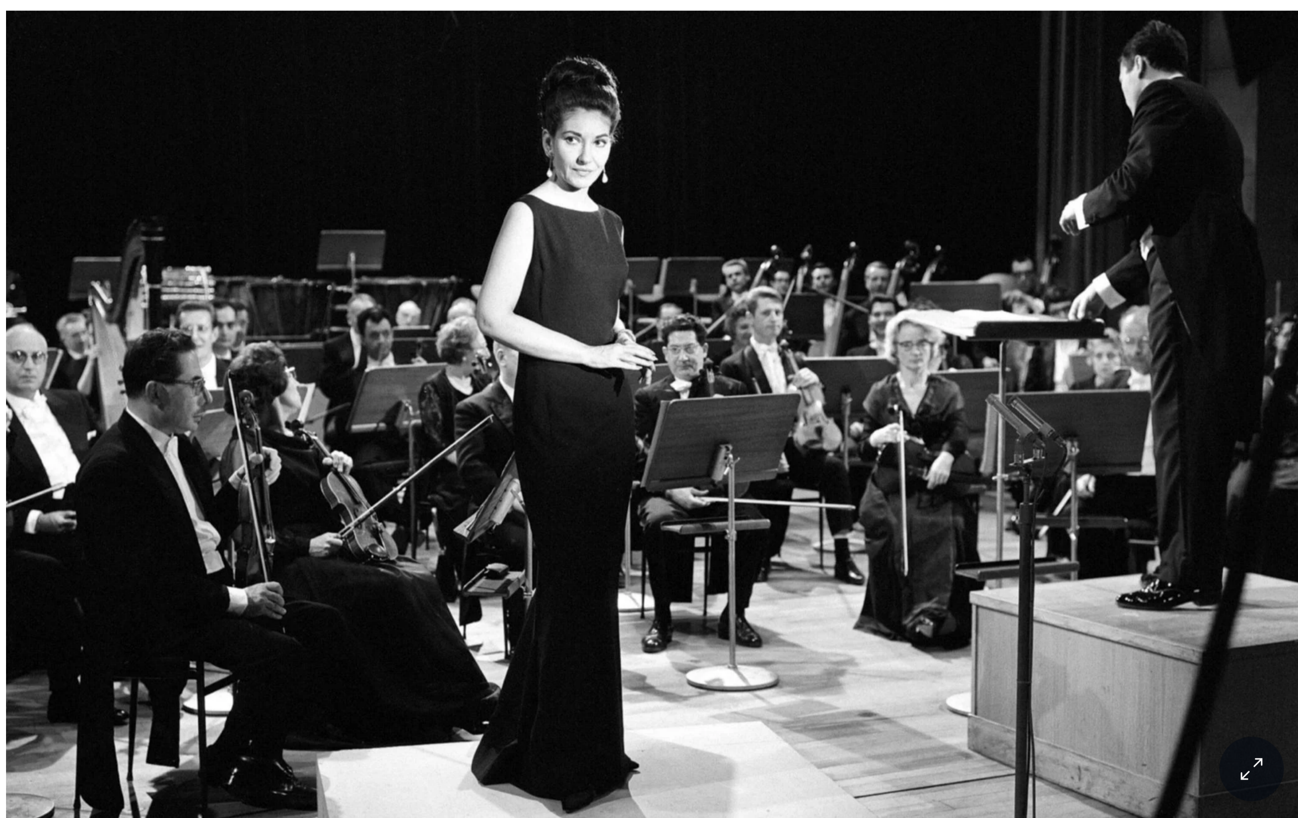
Die Callas im Studio des staatlichen französischen Rundfunks ORTF: Für 349,99 Euro erhält der Musikfreund eine opulente Sammlung ihrer Aufnahmen.

AA Social sharing icons: Facebook, Twitter, Email, Print